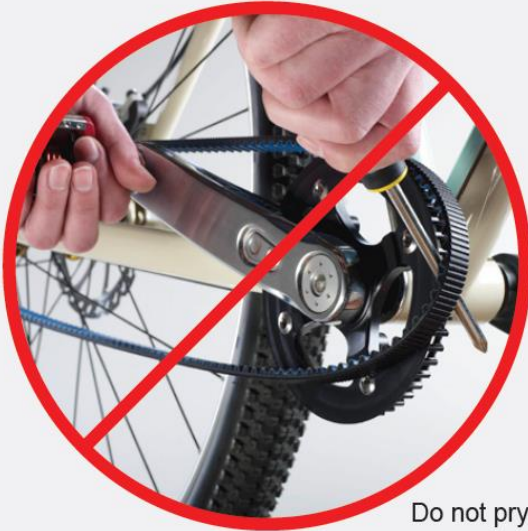
Do not pry

WARNING: when installing the belt, do not pry the belt onto sprocket or “roll” the belt on by rotating cranks. Doing so could damage the belt and lead to failure. Belt must be installed loosely and then tension when in place.