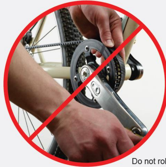
Do not roll